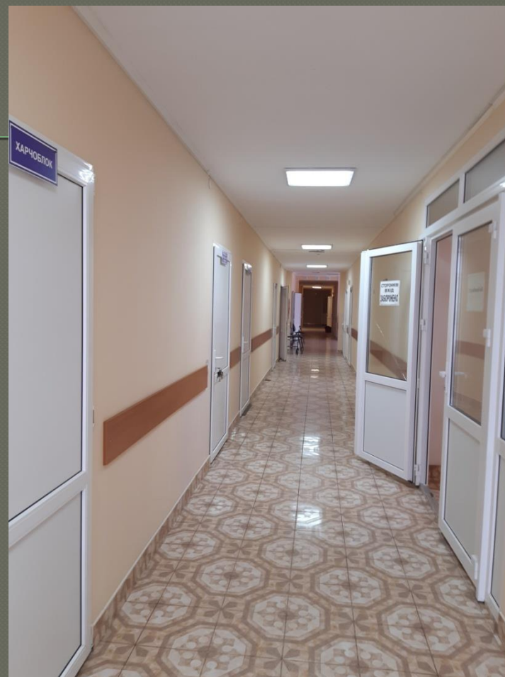
Коридор ( I поверх )