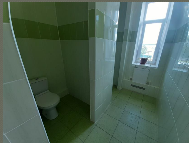
Санвузол ( II поверх)