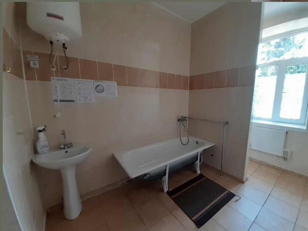
Ванна кімната ( I поверх)