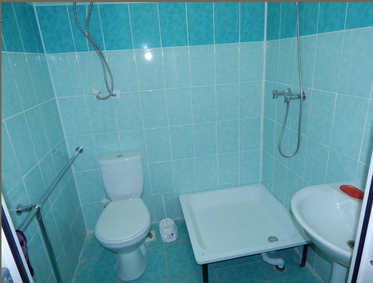
Ванна кімната і санвузол ( II поверх)