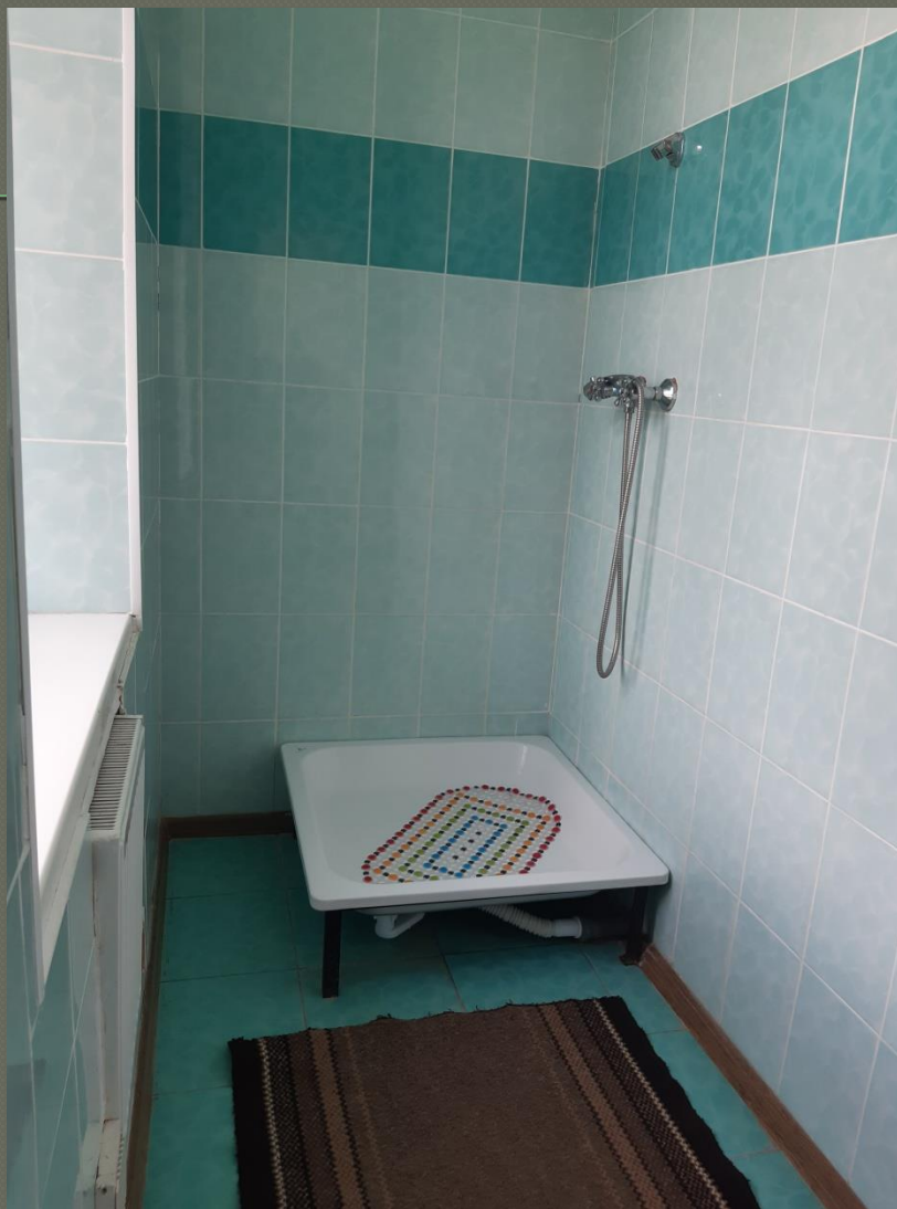
Ванна кімната ( II поверх)