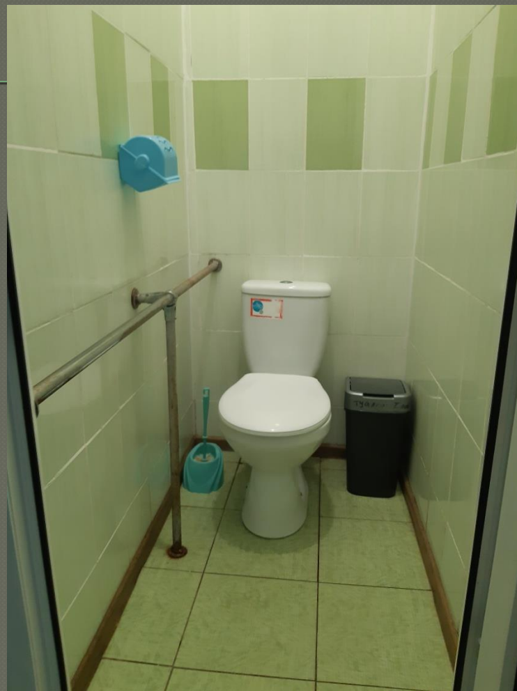
Санвузол ( I поверх)