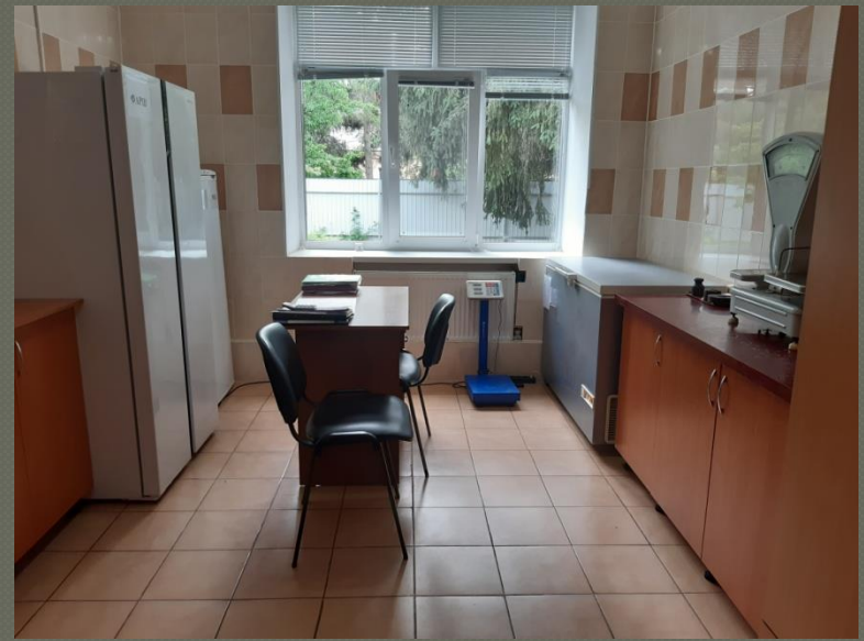
Кладова для зберігання продуктів харчування