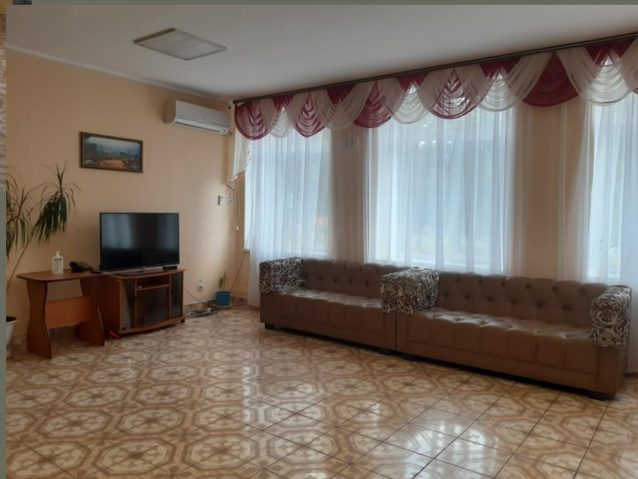
Хол ( I поверх )