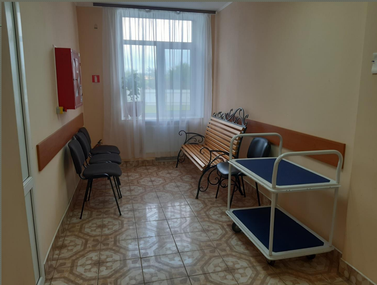
Коридор ( I поверх)