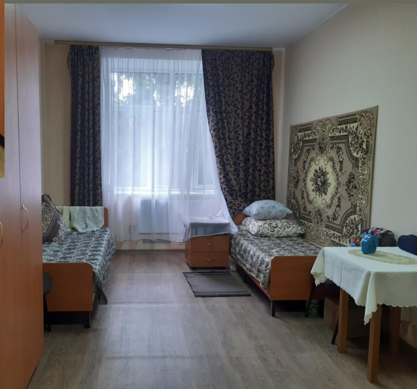
Кімнати для проживання ( I поверх)