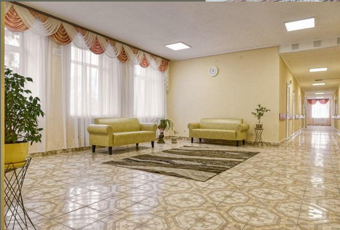
Хол ( II поверх )