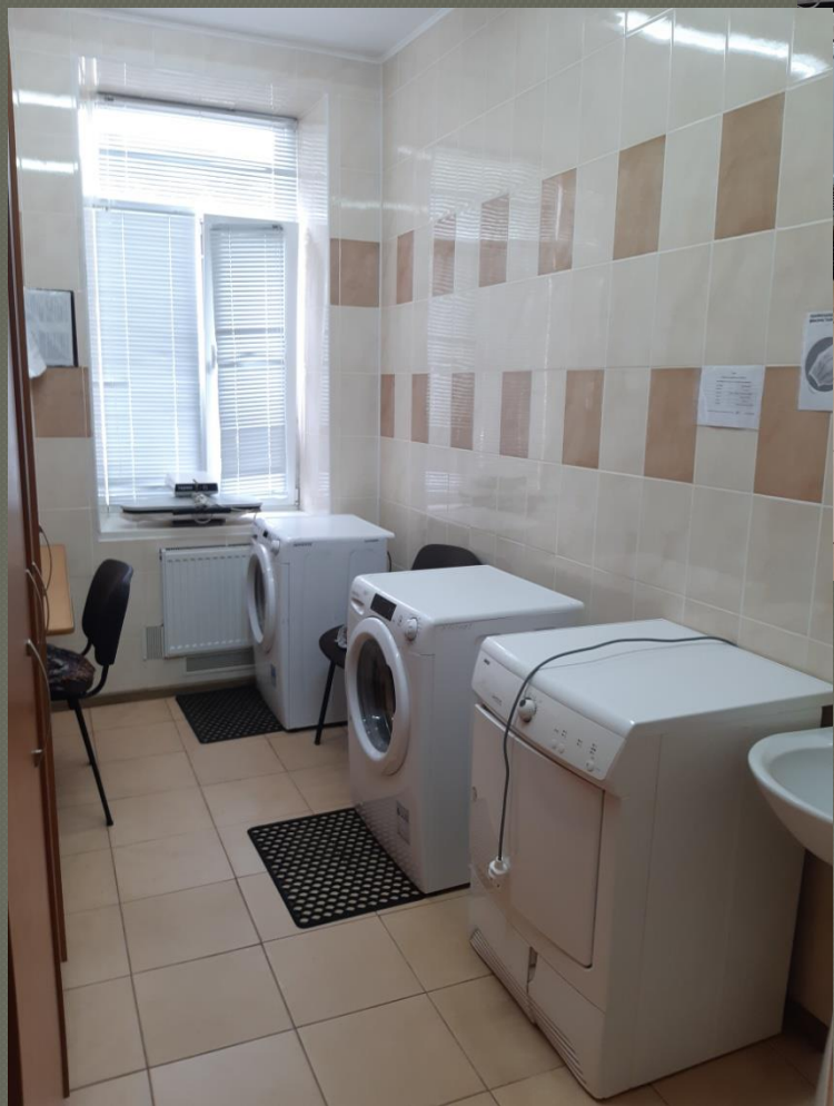
Пральня ( I поверх )