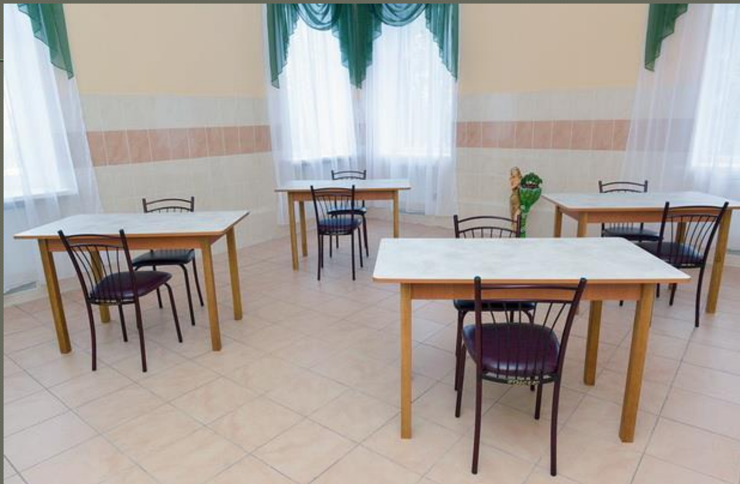
Їдальня ( II поверх)