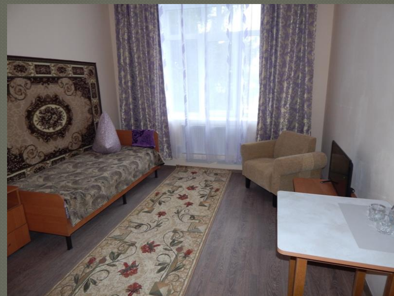
Кімнати для проживання покращеного комфорту ( II поверх)