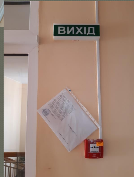
Автоматична пожежна сигналізація