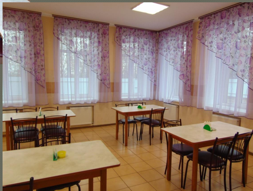
Їдальня ( I поверх )