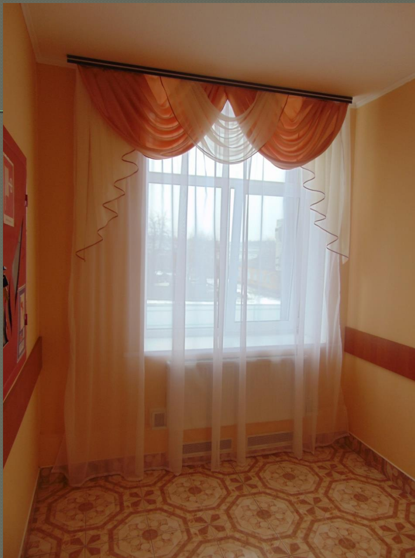
Коридор ( II поверх)