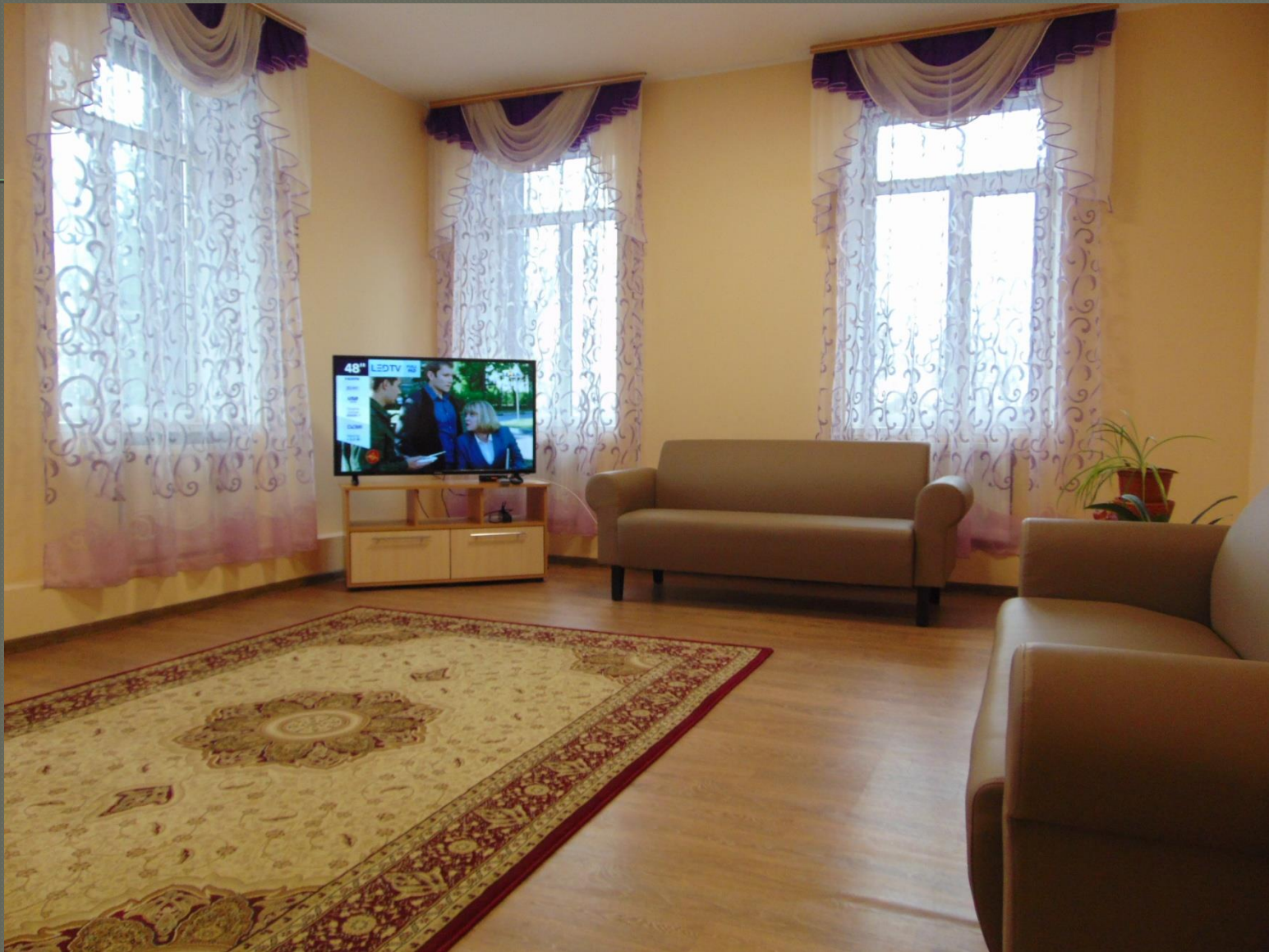
Кімната відпочинку ( II поверх)