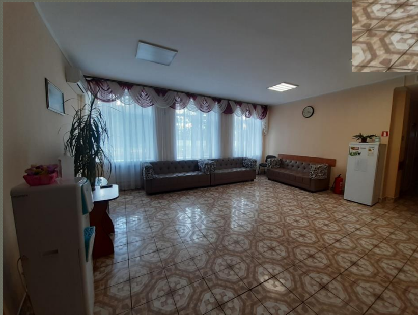
Хол ( I поверх )