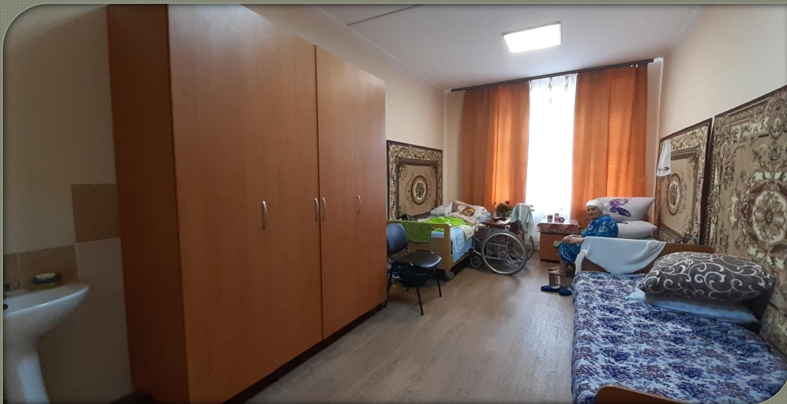
Кімнати для проживання ( I поверх)