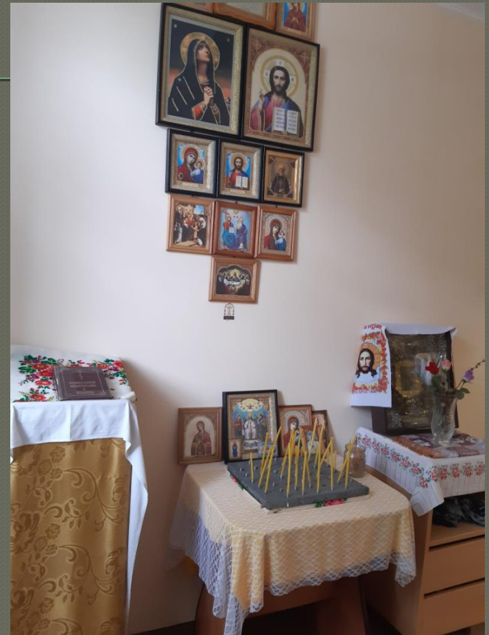
Капличка ( I поверх )