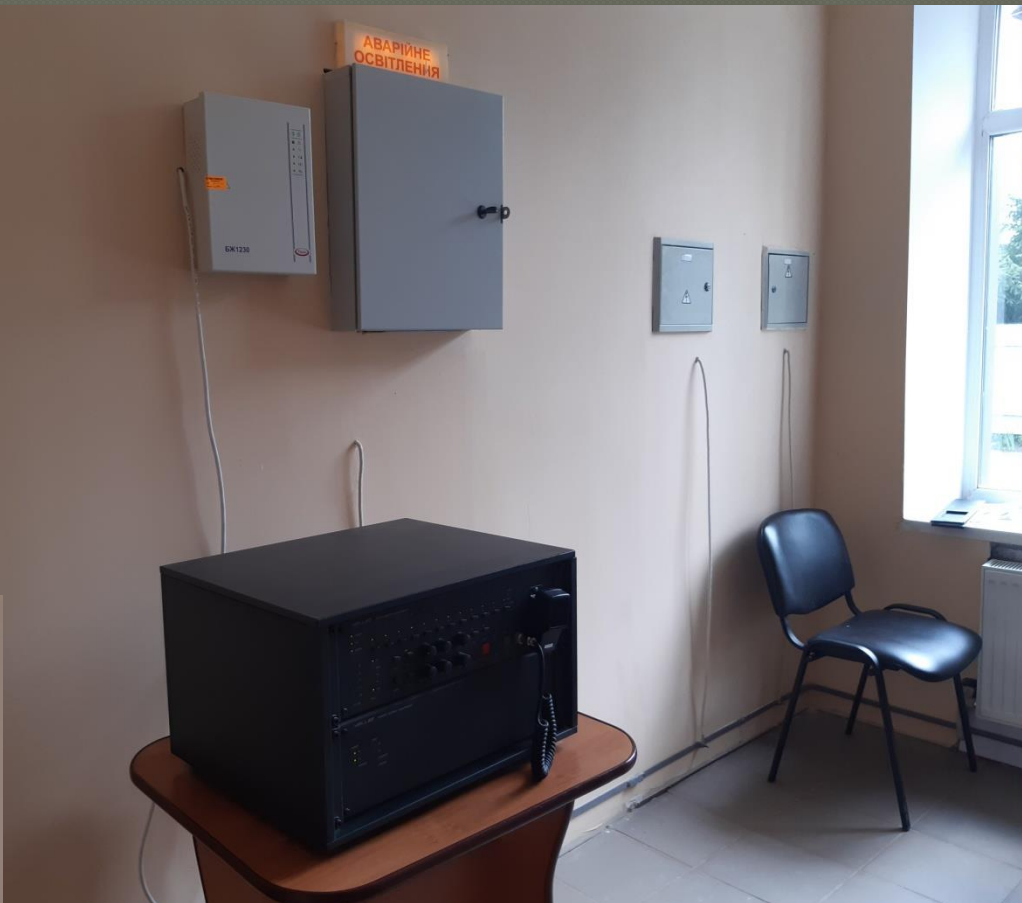
Автоматична пожежна сигналізація