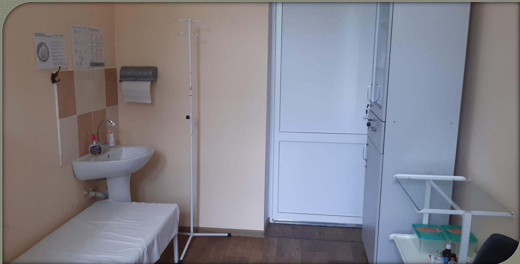
Кімната медичної сестри